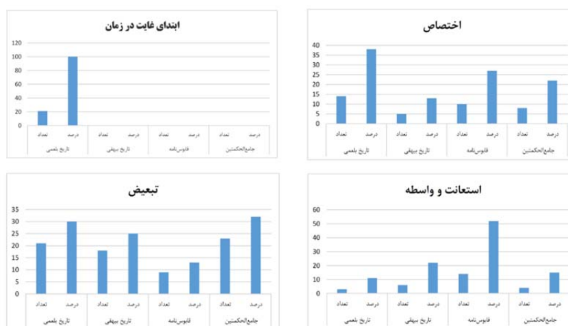
شکل ۲. مقایسه فراوانی «از» به معانی «اختصاص»، «ابتدای غایت در زمان»، «استعانت» و «تبعیض»

شکل شماره ۱ تا ۸ فراوانی معانی مختلف «از» در چهار کتاب مورد پژوهش نسبت به یکدیگر مقایسه شده است. که در ادامه هر یک از نمودارها به تفکیک تحلیل خواهد شد.