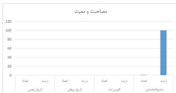
شکل ۸. مقایسه فراوانی «از» به معانی «توضیح»، «مقدار و اندازه»، «برای»، «بر» و «مصاحبت و معیت»

حرف «از» در معنی «نشانه مفعولی را» با ۵۱ بار تکرار در مجموع دو دوره بیشترین کاربرد را در کتاب قابوس‌نامه با فراوانی نسبی ۳۹ درصد و کمترین کاربرد را در کتاب تاریخ بیهقی با فراوانی نسبی ۱۴ درصد دارد. در مجموع ۵۳ درصد فراوانی این معنی به دو کتاب نثر بینابین (قابوس‌نامه و تاریخ بیهقی) تعلق دارد. در مقایسه دو دوره، «از» در معنی «نشانه مفعولی را» رتبه سوم پرکاربردترین معنی این حرف را در دوره دوم به‌خود اختصاص داده‌است. «از» در معنی «مجاوزت» با ۶۶ بار تکرار در مجموع دو دوره بیشترین کاربرد این معنی را به ترتیب در کتاب‌های جامع‌الحکمتین با ۳۸ درصد، قابوس‌نامه با ۲۷ درصد، تاریخ بلعمی با ۲۰ درصد و تاریخ بیهقی با ۱۵ درصد داشته‌است. در مجموع ۵۸ درصد فراوانی این معنی به دو کتاب نثر مرسل دوره سامانی تعلق دارد. در مقایسه دو دوره، «از» در معنی «مجاوزت» رتبه دوم پرکاربردترین معنی این حرف را در دوره اول دارد. «از» در معنی اصلی خود «ابتدای غایت در مکان» در مجموع با ۱۳ بار تکرار و فراوانی نسبی ۷۷ درصد بیشترین کاربرد را در تاریخ بیهقی دارد. تاریخ بلعمی و جامع‌الحکمتین به ترتیب با ۱۵ و ۸ درصد بقیه این فراوانی را دارند. در کتاب قابوس‌نامه موردی برای این معنی مشاهده نشد.