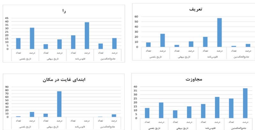
شکل شماره ۷: مقایسه فراوانی «از» به معانی «تعریف»، «نشانه مفعولی»، «مجاوزت» و «ابتدای غایت در مکان»

حرف «از» در معنی «کسره اضافه» در مجموع با ۱۲ بار تکرار بیشترین کاربرد را در کتاب جامع‌الحکمتین با فراوانی نسبی ۵۰ درصد و کمترین کاربرد را در کتاب تاریخ بلعمی با فراوانی نسبی ۸ درصد داشته‌است. در مجموع دوکتاب نثر مرسل سامانی ۵۸ درصد و دوکتاب نثر بینابین ۴۲ درصد این معنی را به‌خود اختصاص داده‌اند. حرف «از» در معنای «مقایسه» در مجموع با ۶ بار تکرار فقط در کتاب قابوس‌نامه و جامع‌الحکمتین به‌تساوی با فراوانی نسبی ۵۰ درصد به‌کاررفته‌است. موردی برای این معنی در دوکتاب دیگر نثر مرسل و بینابین (تاریخ بلعمی و تاریخ بیهقی) مشاهده‌نشد.