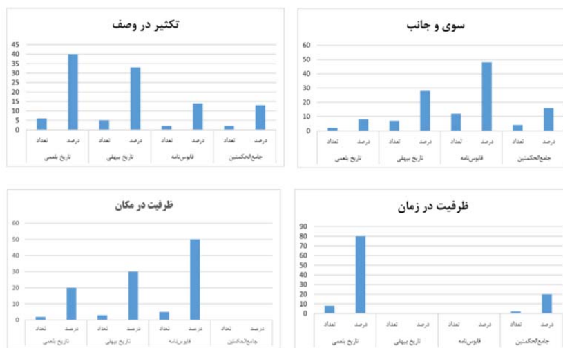
شکل ۴. مقایسه فراوانی «از» به معنای «سوی و جانب»، «تکثیر در وصف»، «ظرفیت زمانی و مکانی»

کاربرد را با فراوانی نسبی ۵۰ و ۱۶ درصد در کتاب‌های تاریخ بلعمی و جامع‌الحکمتین (نثر دوره سامانی) و ۳۴ درصد آن به دو کتاب نثر بینابین اختصاص دارد.