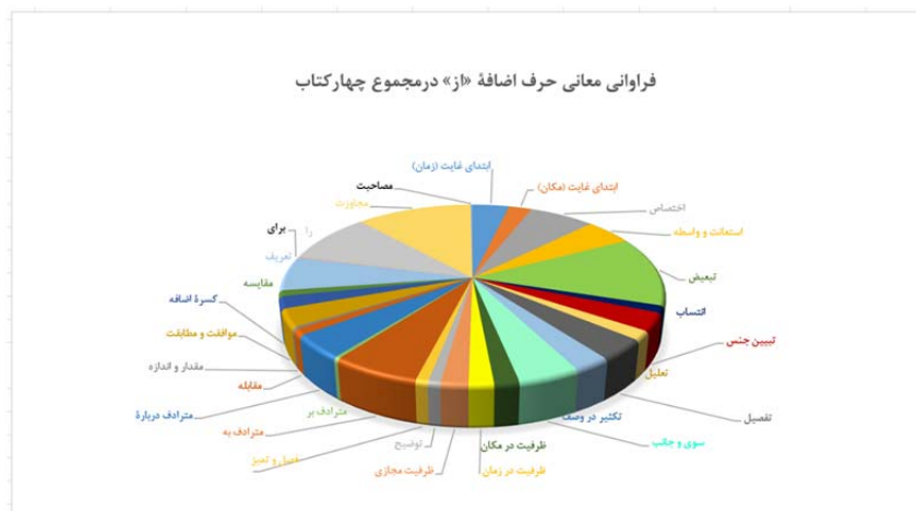
شکل ۹. نمودار دایره‌ای فراوانی مطلق حرف اضافه «از» در مجموع چهار کتاب به تفکیک معانی