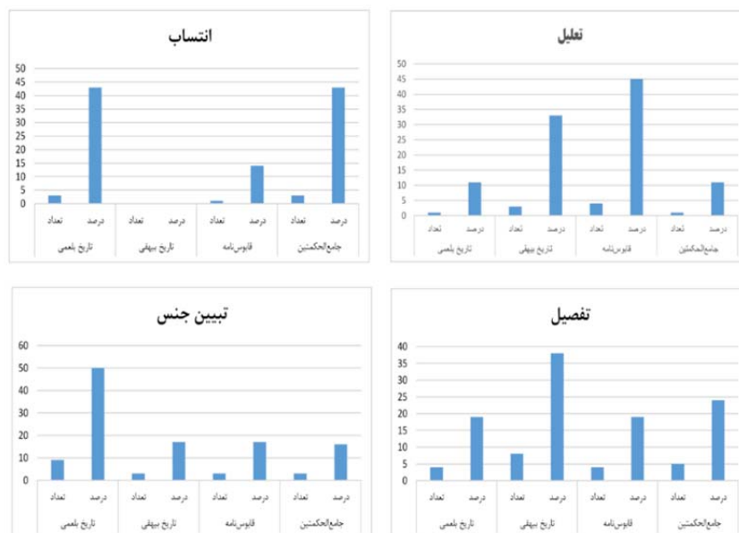
شکل ۳. مقایسه فراوانی «از» به معانی «تعلیل»، «انتساب»، «تفصیل» و «تبیین جنس»