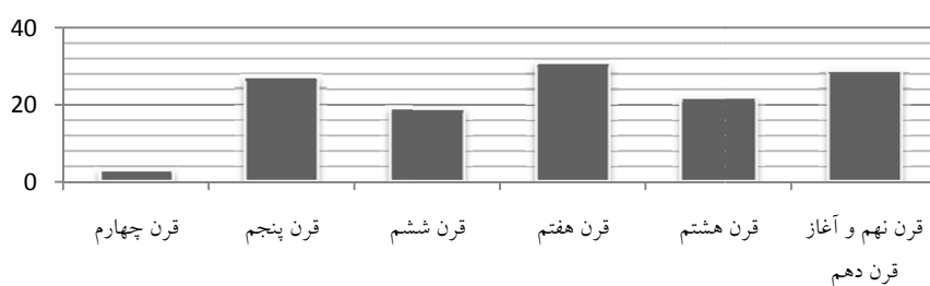
نمودار ۱. بسامد درونه‌گیری‌های ابزاری (در مجموع ۱۲۸ اثر)

بسامد به‌کارگیری این سه گونه درونه‌گیری در دوره مورد بحث (با اغماض در به شمار آوردن برخی آثار بدون تاریخ قطعی و نیز چند اثر از آغاز قرن دهم) را می‌توان در سه نمودار ذیل مستقلاً تبیین کرد. گفتنی است از آن‌جا که این پژوهش به هیچ وجه ادعای بررسی همه نمونه‌های ممکن را ندارد، این نمودارهای آماری فقط می‌توانند شمایی کلی از بسامد آثار به دست دهند. ضمن آن‌که می‌دانیم چنین نمودارهایی را به سادگی و بدون توجه به شاخص‌های فرهنگی، سیاسی و اجتماعی هر دوره نمی‌توان و نباید تحلیل کرد.