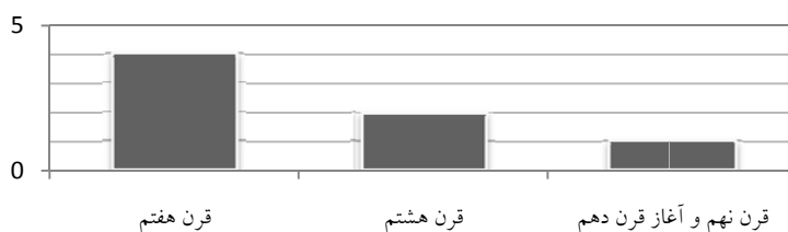
نمودار ۳. بسامد درونه‌گیری‌های ترکیبی (در مجموع ۷ اثر)