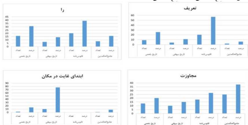
شکل شماره ۷: مقایسه فراوانی «از» به معانی «تعریف»، «نشانه مفعولی»، «مجاوزت» و «ابتدای غایت در مکان»

حرف «از» در معنی «کسره اضافه» در مجموع با ۱۲ بار تکرار بیشترین کاربرد را در کتاب جامع‌الحکمتین با فراوانی نسبی ۵۰ درصد و کمترین کاربرد را در کتاب تاریخ بلعمی با فراوانی نسبی ۸ درصد داشته است. در مجموع دو کتاب نثر مرسل سامانی ۵۸ درصد و دو کتاب نثر بینابین ۴۲ درصد این معنی را به خود اختصاص داده‌اند. حرف «از» در معنای «مقایسه» در مجموع با ۶ بار تکرار فقط در کتاب قابوس‌نامه و جامع‌الحکمتین به تساوی با فراوانی نسبی ۵۰ درصد به کار رفته است. موردی برای این معنی در دو کتاب دیگر نثر مرسل و بینابین (تاریخ بلعمی و تاریخ بیهقی) مشاهده نشد.