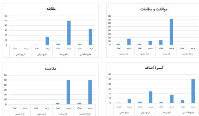
شکل ۶. مقایسه فراوانی «از» به معانی «موافقت و مطابقت»، «مقابله»، «کسرة اضافه» و «مقایسه»

جامع‌الحکمتین ۳۳ درصد و در قابوس‌نامه ۱۳ درصد بوده‌است. موردی برای این معنی در کتاب تاریخ بیهقی مشاهده‌نشد. در مجموع ۸۷ درصد این معنی به دو کتاب نثر مرسل دوره سامانی تعلق داشته‌است. «از» به معنی «به» در مجموع با ۳۶ بار تکرار بیشترین فراوانی کاربرد آن در کتاب‌های نثر بینابین است. کاربرد این معنی در قابوس‌نامه ۳۶ درصد، تاریخ بیهقی ۳۱ درصد، تاریخ بلعمی ۲۲ درصد و جامع‌الحکمتین ۱۱ درصد بوده‌است. در مجموع بیشترین تکرار این معنی با فراوانی تجمعی ۶۷ درصد مربوط به کتاب‌های نثر بینابین، و کمترین کاربرد آن با فراوانی تجمعی ۳۳ درصد مربوط به کتاب‌های نثر مرسل سامانی است. در مقایسه دو دوره، دو معنی «از»: «به» و «تعریف» به‌اشتراک رتبه چهارم پرکاربردترین معنی «این حرف را در دوره دوم دارند